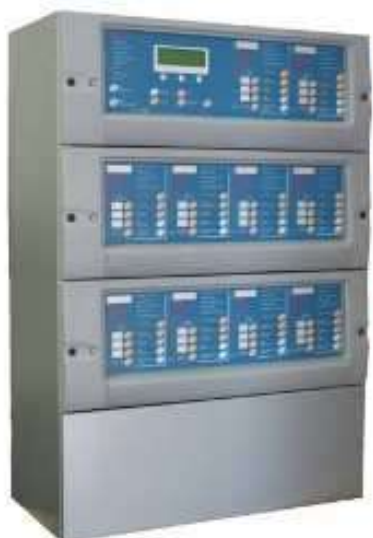
1. Système de Sécurité Incendie Unité de Signalisation Unité de Gestion d'Alarme Unité de commandes manuelles