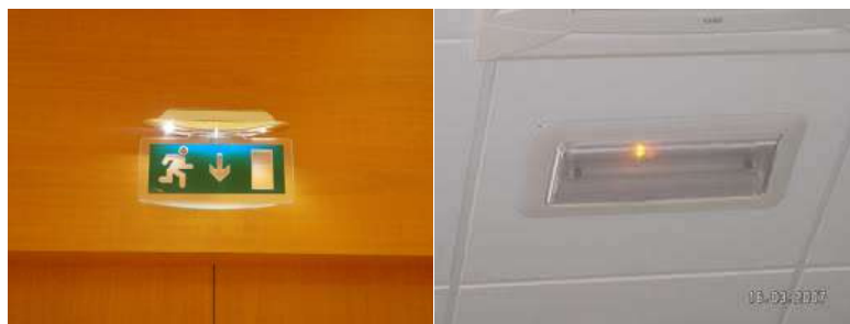
Bloc d'éclairage de sécurité d'évacuation (sortie) / Bloc d'éclairage de sécurité d'ambiance (locaux)

Visuels : Insertion photos des sorties et issues de secours de l'établissement afin de les visualiser