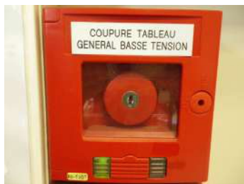
Arrêt d'urgence électrique