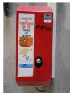
Commande de désenfumage et exutoire de fumées Escaliers protégés

NE RIEN STOCKER DEVANT LES AMENEES D'AIR