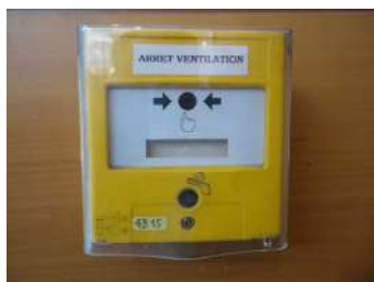
Arrêt d'urgence ventilation