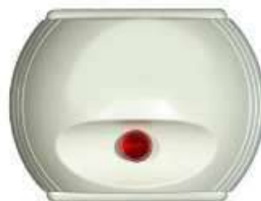
3. Indicateur d'action des détecteurs situés à l'intérieur des chambres visibles dans la circulation