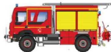
4 ème minute

Or le délai d'intervention des sapeurs-pompiers peut aller de 10 min en zone urbaine à 25 min en zone rurale.