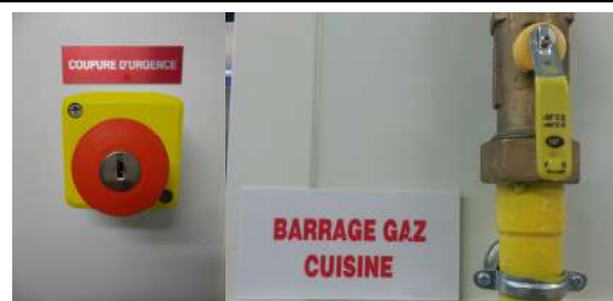
Arrêt d'urgence électrique appareils de cuisson Vanne barrage gaz appareil de cuisson