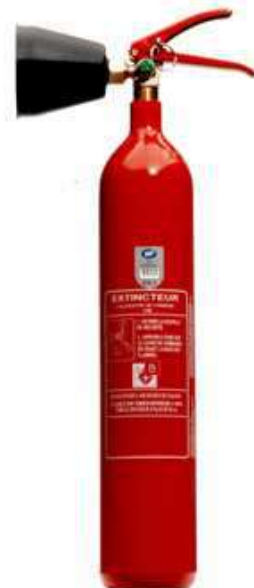
Extincteur CO2 B (et C) A pression permanente Feu de liquide – Gaz Adapté aux risques électriques