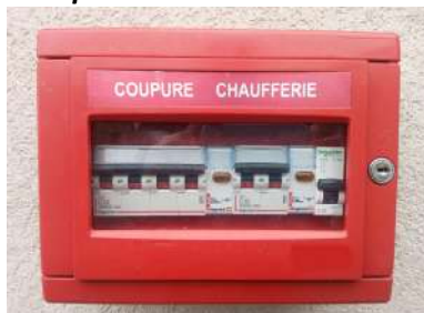
Coupure de la « force » électrique