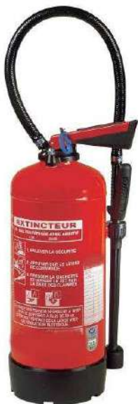
Extincteur à Eau pulvérisé AB A pression auxiliaire Avec ou sans additif Feu matières solides et liquides

Localisation : à adapter aux types d'extincteur réellement présents dans votre établissement