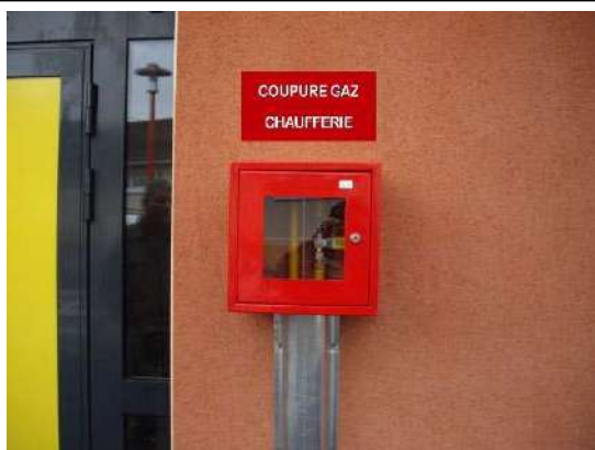
Coupure du combustible GAZ