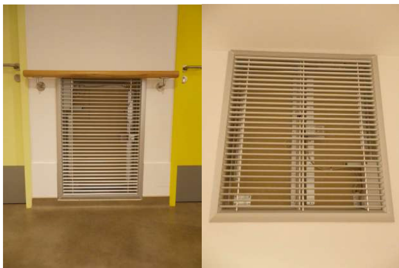
Volets d'amenée d'air (basse) et d'extraction de fumées (haute) dans les circulations horizontales

NE RIEN STOCKER DEVANT LES AMENEES D'AIR