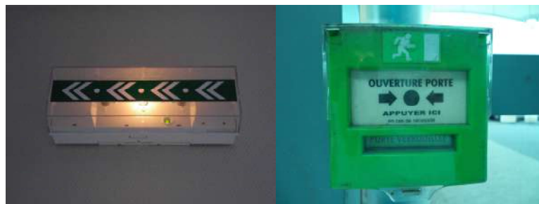
Balisage des cheminements - Déclencheur manuel de déverrouillage