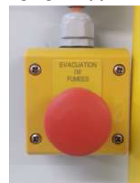
Commande manuelle des ventilateurs d'extraction « évacuation des fumées »