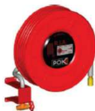
3 ème minute