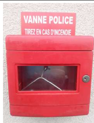
Coupure du combustible FIOUL