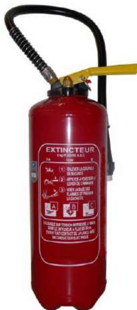
Extincteur Poudre ABC A pression auxiliaire Tout type de feu