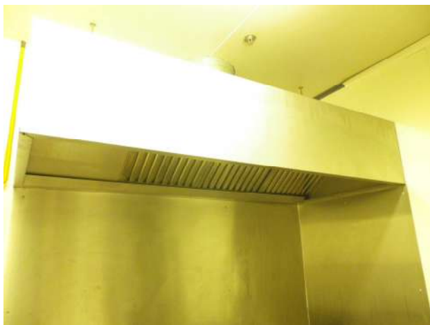
Ventilation des grandes cuisines Matériaux MO – conduit métallique & rigide (isolée) Ventilateurs d'extraction 1 heure – 400°C (ouverte)