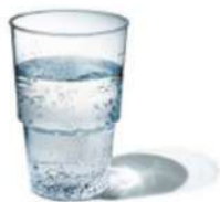
1 ère minute