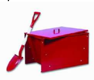
Bac produit absorbant en cas d'écoulement