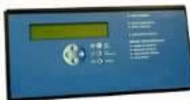
2. Tableau répéteur d'alarme par niveau avec report des informations d'alarme feu et la localisation de la zone de détection